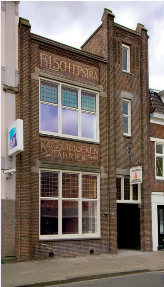
6 7 KANTORBOEKENFABRIEK SCHEEPSTRA (1917) AAN DE ZUIDERGRACHTSWAL, DOOR H.H. KRAMER. DE FABRIEK IS IN 2007-'08 VOOR DE STICHTING DBF GERESTAUREERD EN GESCHIKT GEMAAKT ALS BEDRIJFSVERZAMELGEBOUW DOOR JELLE DE JONG ARCHITECTEN.