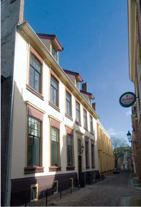
5 HET PATERSHUIS AAN DE BAGIJNENSTRAAT, ONDERDEEL VAN HET LAAT-MIDDELEEUWSE GRAUWE BAGIJNENKLOOSTER, IS IN 2007 GERESTAUREERD EN VERBOUWD TOT APPARTEMENTEN. ONTWERP ADEMA ARCHITECTEN VOOR LONT PLAN.