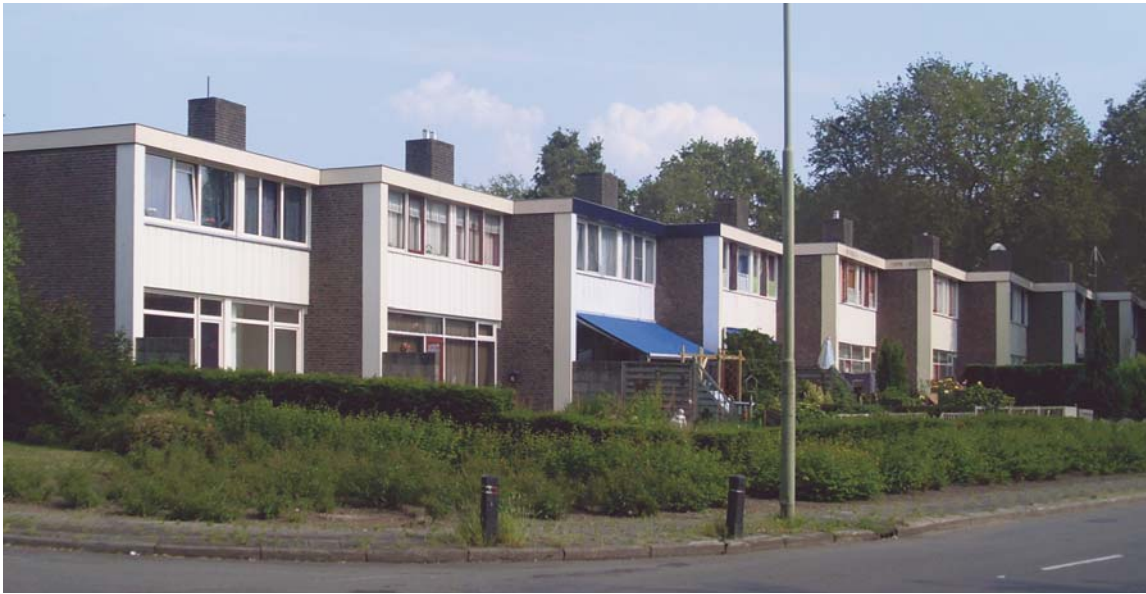
4 – ANGELSLO, TWEELAAGS WONINGBLOK VAN ARCHITECT VAN J.J. STERENBERG. OPVALLEND IS DE ZAAGTANDSGEWIJZE VERSPRINGING VAN DE ROOILIJN. STERENBERG (VANAF 1978 HOOGLERAAR SERIEMATIGE WONINGBOUW AAN DE T.H. DELFT) TOONT HIER HOE HET PERSOONLIJKE ESTHETISCHE CACHET VAN DE ARCHITECT TOT UITDRUKKING KAN KOMEN BINNEN HET GENORMALISEERDE KADER VAN DE SYSTEEMBOUW. FOTO: MARGREETH BANGERT

5 – EEN VAN DE CHARMES VAN ANGELSO IS DAT STEDENBOUWKUNDIGE NIEK DE BOER GEBRUIK HEEFT GEMAAKT VAN DE AANWEZIGE BOMEN OM DE WIJK AAN TE KLEDEN EN IN TE BEDDEN. GEEN 'BLANK CANVAS', MAAR EEN OPTIMAAL HANDHAVEN VAN 'HISTORISCH GROEN' BLIJKT VAKER VOOR TE KOMEN BIJ FUNCTIONALISTISCHE STEDENBOUW DAN TOT DUSVER WERD GEDACHT. FOTO: MARGREETH BANGERT