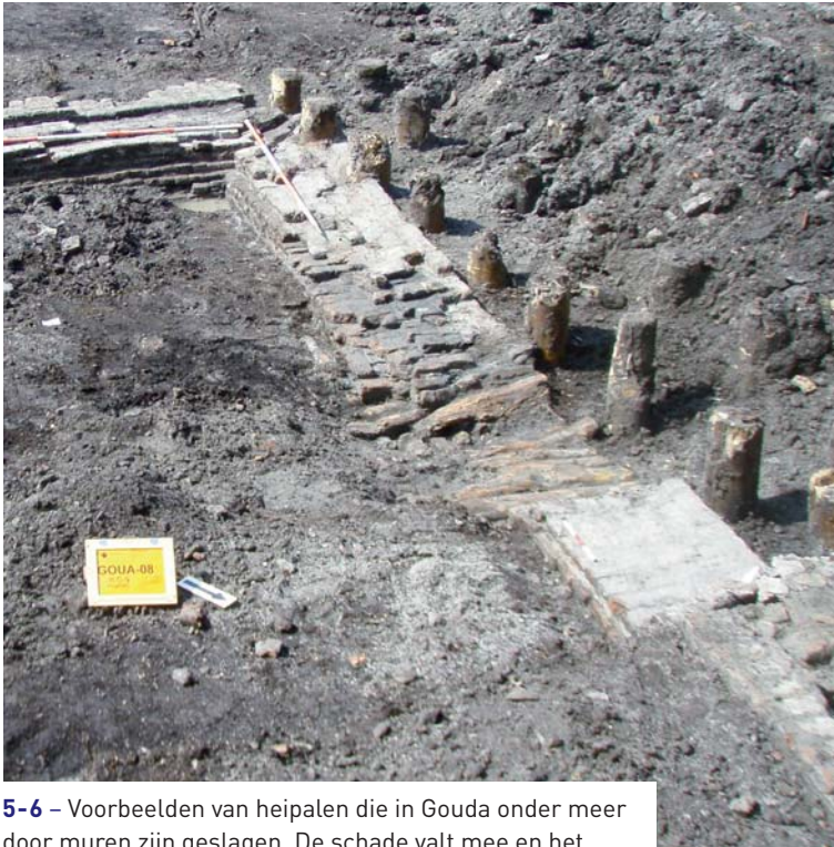
5-6 – Voorbeelden van heipalen die in Gouda onder meer door muren zijn geslagen. De schade valt mee en het informatieverlies is zeer gering.