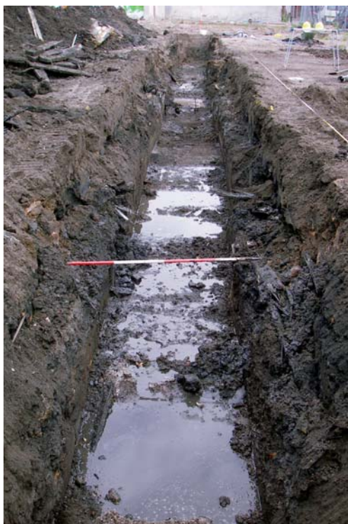
3 – Voorbeeld van archeologievriendelijk bouwen: het oude riool is verwijderd, het nieuwe kan straks in dezelfde sleuf worden teruggeplaatst.

Ook 5% blijft discutabel, andere getallen zijn net zo goed verdedigbaar. Naar onze mening is het percentage in elk geval eerder te streng dan te ruim. Immers, als op voorhand van een vindplaats bekend is dat, bijvoorbeeld, 20% is verstorend, is dat dan reden om de vindplaats maar niet meer op te graven? Naar alle waarschijnlijkheid niet, en dus is 5% volgens ons geen probleem. Belangrijkste is echter dat er een keuze