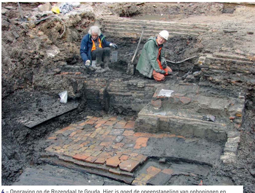
4 – Opgraving op de Rozendaal te Gouda. Hier is goed de opeenstapeling van ophogingen en woonniveau's te zien. Daarnaast is duidelijk dat de conservering goed is, ondanks het feit dat ook deze locatie voorafgaand aan de opgraving overbouwd was.