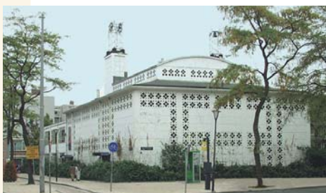
TWEE VOORBEELDEN: DE PNIELKERK (BOVEN - 1954, AMSTERDAM-WEST) TOT VOOR KORT GEBEDSHUIS VAN DE GEREFORMEERDE KERK - NU INTERNATIONAAL CULTUURPODIUM, EEN HUISARTSENPOST, KANTOOR-, STUDIO- EN ATELIERRUIMTEN.