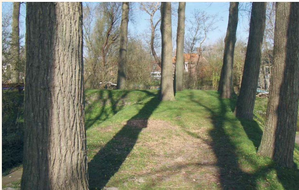
'INMIDDELS GINGEN WIJ WANDELEN, EERST OP DEN WAL, DIE NIETS BIJZONDERS HEEFT, DAN DAT HIJ MET BOOMEN BEPLANT IS, EN DAN IN DEN STAD.' (UFFENBACH, 1710)